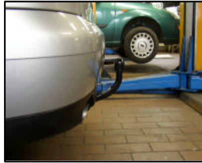
AHK von der Seite