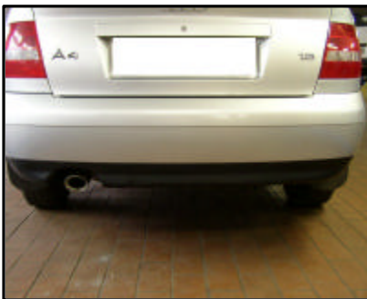
Fahrzeug ohne Kugelkopf