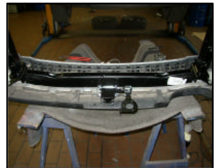
Anbau der Ahk