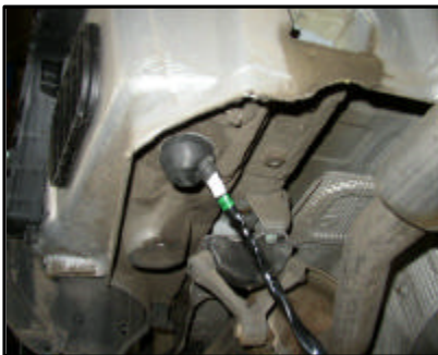
Anschluss des E-Satzes, Kabeldurchführung