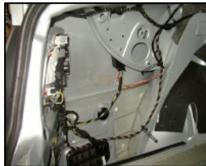
Anschluss des E-Satzes