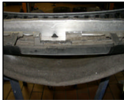
Abbau der Stoßstange, Ausarbeitung des Grundträgers