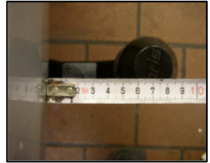
Abstand vom KK zur Stoßstange