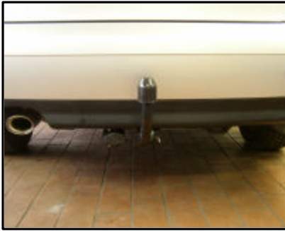
Fahrzeug mit AHK