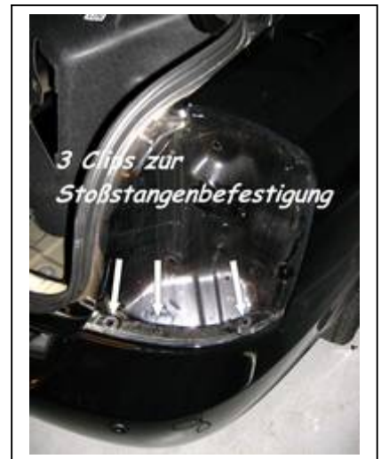
Zur Demontage Heckschürze links und rechts je 3 Befestigungsclips entfernen.