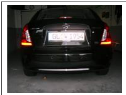
Fahrzeug vor dem Einbau