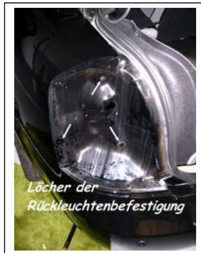
Rückleuchte links u. rechts ausbauen, dazu je 3 Muttern von innen entfernen. Die Stecker zu Stromversorgung Trennen.