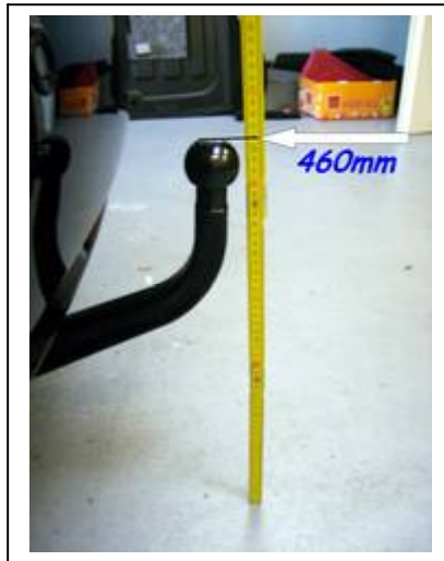
Hohe Oberkante Kugelkopf