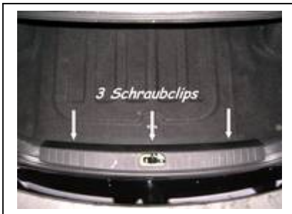
Bodenverkleidung u. Schlossabdeckung