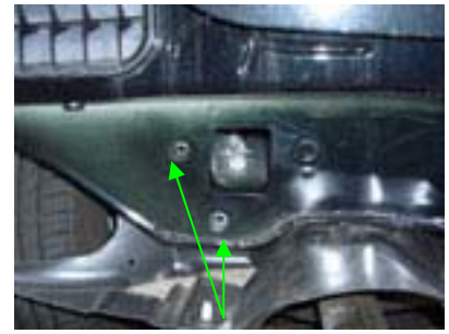
Montagepunkte Kupplung links