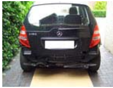
Fahrzeug ohne Stoßfängergrundträger