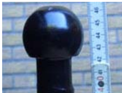
Kupplung von der Seite