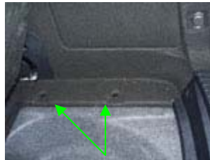
Seitenverkleidung rechts und links