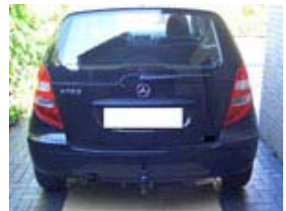
Fahrzeug von hinten