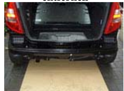
Fahrzeug ohne Stoßfänger