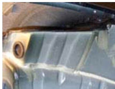
Radhaus ohne Verkleidung