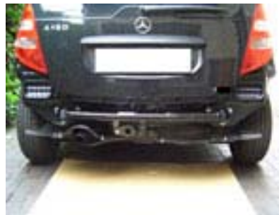
Fahrzeug mit Kupplung