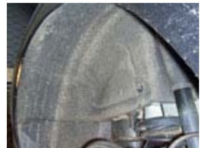
Radhausverkleidung rechts und links entfernen