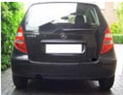
Fahrzeug vor dem Einbau